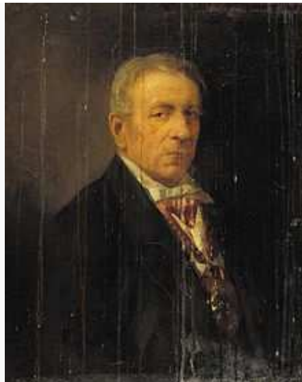
Ángel de Saavedra, duque de Rivas Artículo principal: Duque de Rivas.