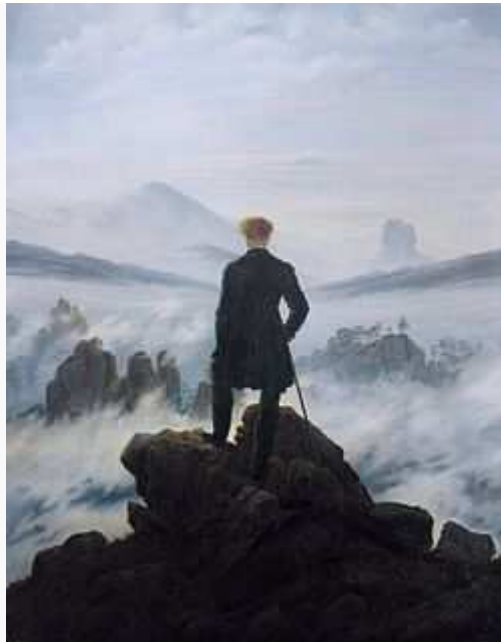
El caminante sobre el mar de nubes de Caspar David Friedrich (Kunsthalle, Hamburgo)