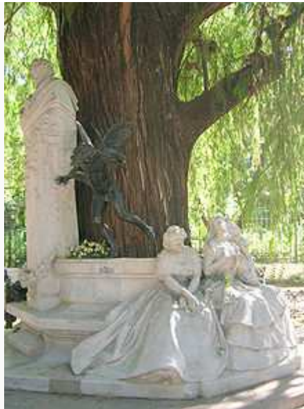
Escultura dedicada a Bécquer, en Sevilla

Los poetas románticos componen sus poemas en medio de un arrebato de sentimientos, plasmando en versos todo cuanto sienten o piensan. Según parte de la crítica literaria, en sus composiciones hay un lirismo de gran fuerza, sin embargo conviviendo con versos vulgares y prosaicos.